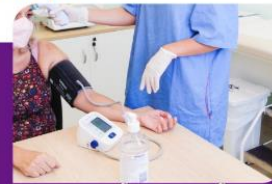
AFERIÇÃO DE PRESSÃO