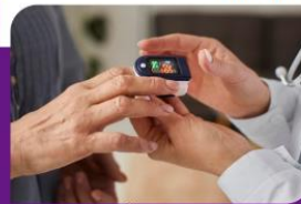
MEDIÇÃO DE GLICOSE